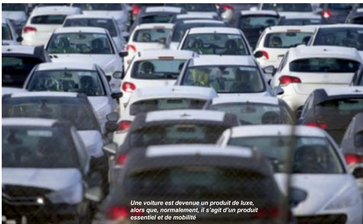
Une voiture est devenue un produit de luxe, alors que, normalement, il s'agit d'un produit essentiel et de mobilité