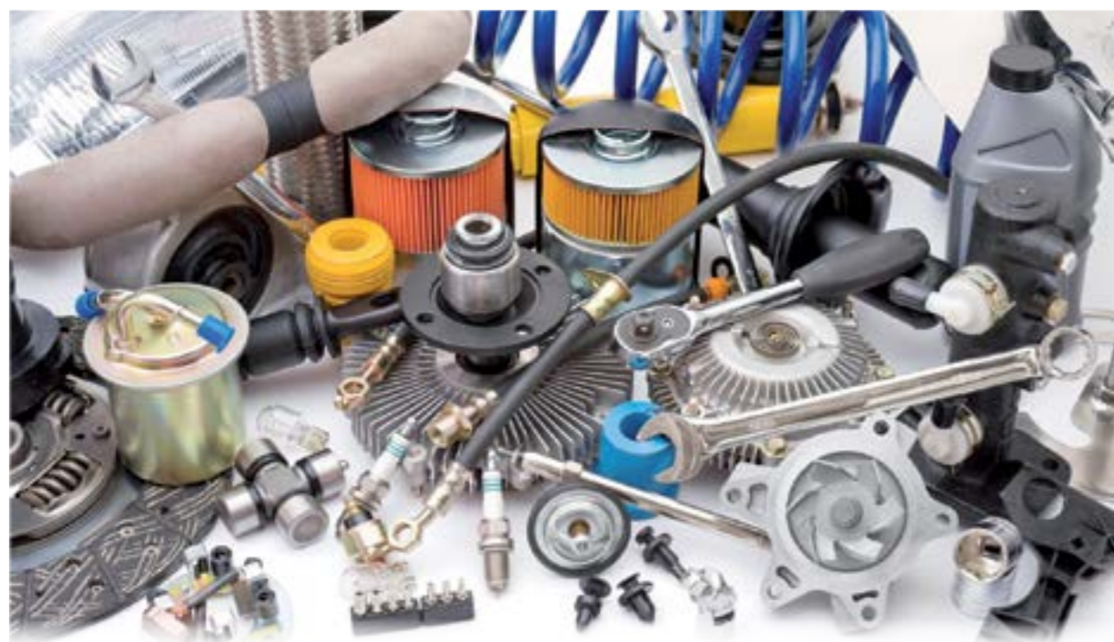
En Tunisie, 85% des pièces de rechange importées sont usées